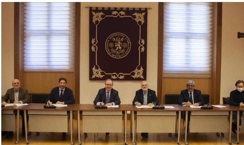
Imagen 1. Acto de fundación

En el mismo acto se acordó la elección de la Junta Directiva de la asociación con la siguiente composición: