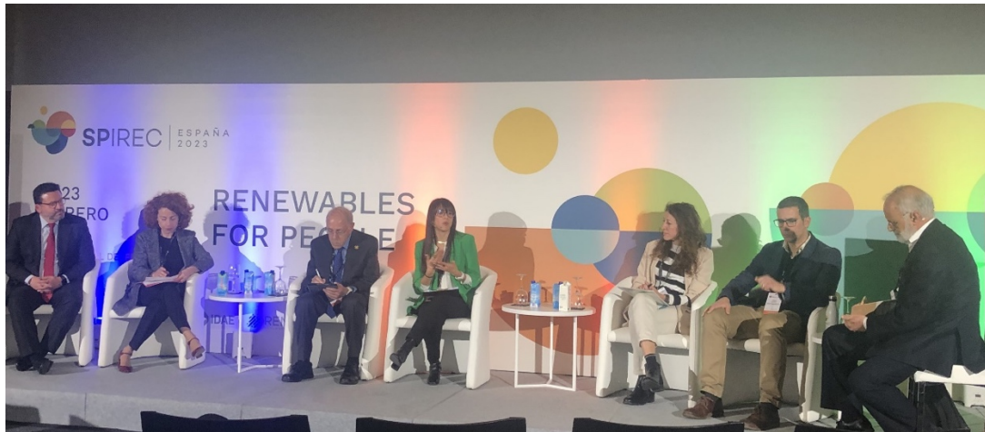
Imagen 2. Mesa Spirec 2023

El Grupo ha trabajado en la redacción de un documento de posicionamiento con el que propone a la Cooperación Española un nuevo enfoque para el acceso universal a la energía, de forma que considere esta primera meta del Objetivo de Desarrollo Sostenible nº 7 (ODS7) como acción prioritaria en futuros Planes Directores.