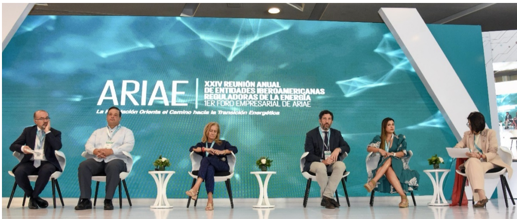
Imagen 3. Participación en ARIAE